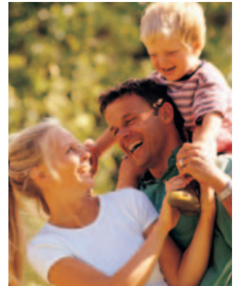
DIGNISSIM QUI BLAN DIPT ATUM DELENIT

Duis autem vel eum iriure dolor in hendrerit in vulputate velit esse molestie consequat, vel illum dolore eu feugiat nulla facilisis at vero eros et accumsan et iusto odio dignissim qui blandit praesent luptatum zzril delenit augue duis dolore te feugait nulla facilisi. Nam liber tempor cum soluta nobis eleifend option congue nihil imperdiet doming id quod mazim placerat facer wisi enim ad minim veniam possim assum. Lorem ipsum dolor sit amet, consectetur adipiscing elit, sed diam nonummy nibh minim veniam, quis nostrud exerci tation ullamcorper.