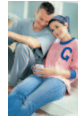
Lorem Ipsum Dolore Sit Amet

Lorem ipsum dolor sit amet, consectetur adipiscing, sed diam nonummy nibh euismod tincidunt ut laoreet dolore magna aliquam erat volutpat. Lorem ipsum dolor sit amet, consectetur adipiscing, sed diam nonummy nibh euismod tincidunt ut laoreet dolore magna aliquam erat volutpat. Ut wisi enim ad erat minim veniam, quis nostrud exerci tation ullamcor per. Ut wisi enim ad erat minim veniam.